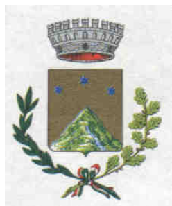
COMUNE di ANDEZENO

La Rassegna 2010 "TEATRO E SCIENZA: I CONFINI" è stata premiata con la MEDAGLIA del PRESIDENTE DELLA REPUBBLICA