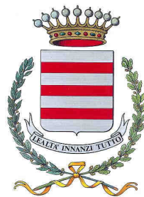
Comune di Castelnuovo don Bosco

La Rassegna 2010 “TEATRO E SCIENZA: I CONFINI” è stata premiata con la MEDAGLIA del PRESIDENTE DELLA REPUBBLICA