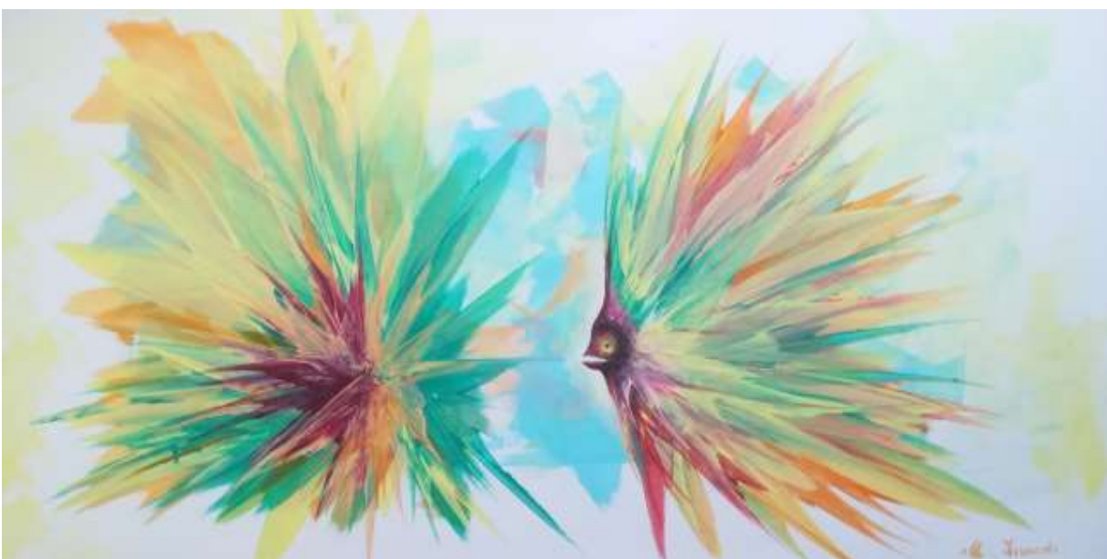
Acrilico spatolato - 50x100 cm