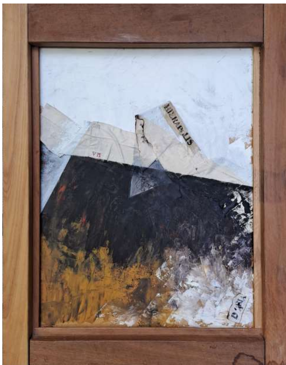
Olio su tavola - 50x40 cm