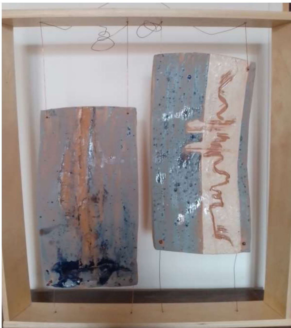
Argilla Toscana e di Vicenza, cottura a gran fuoco - 63x33 cm