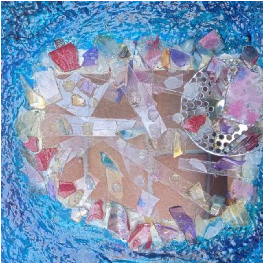
Tecnica polimaterica - 30x30 cm