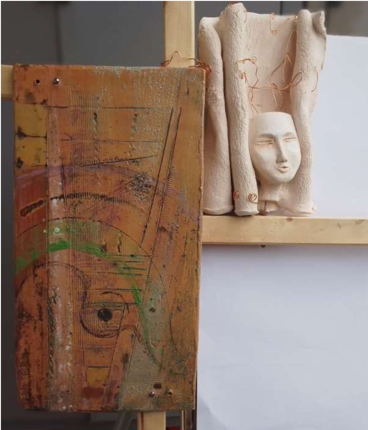
Ceramiche incastonate nel legno - 43x40 cm