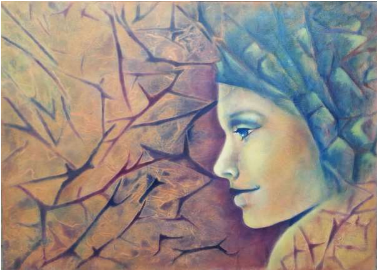
Olio acrilico spatolato - 50x70 cm