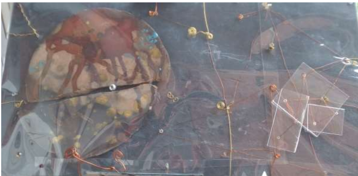
Argilla di Castellamonte cottura raku su plexiglass - 33x63 cm