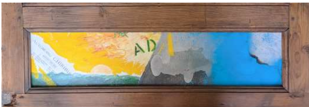
Acrilico su tavola - 17x81 cm