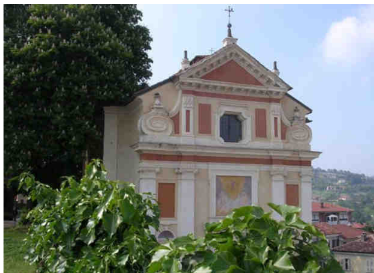
La Chiesa dei Batù di Pecetto Torinese